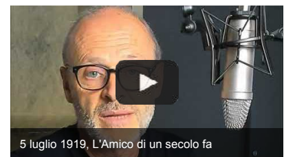
5 luglio 1919, L'Amico di un secolo fa