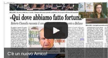
C'è un nuovo Amico!