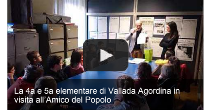
La 4a e 5a elementare di Vallada Agordina in visita all'Amico del Popolo