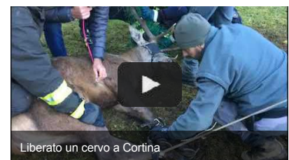
Liberato un cervo a Cortina

Privacy Policy • Cookie Policy • Pubblicità